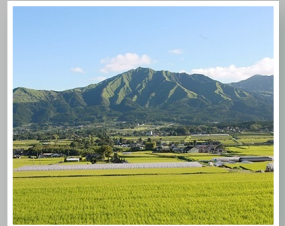
美しい南阿蘇の田園風景